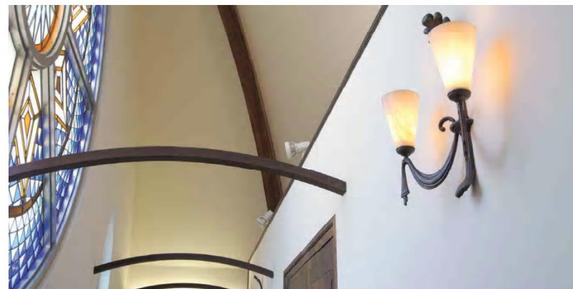
シルダッチ・フラット