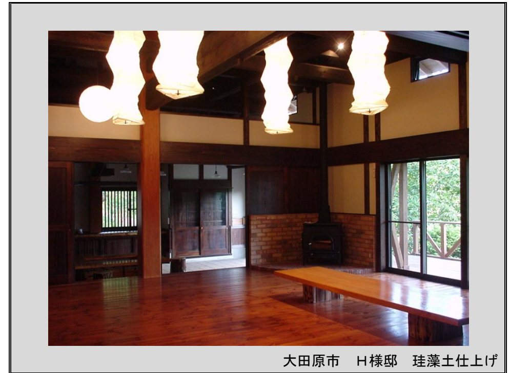
大田原市 H様邸 珪藻土仕上げ

1972年、この地域で左官工事業の会社として創業してから多くのお客様にご愛顧いただき、おかげさまで今年39年目を迎えることができました。感謝の気持ちを込めてありがとう通信を配信します。