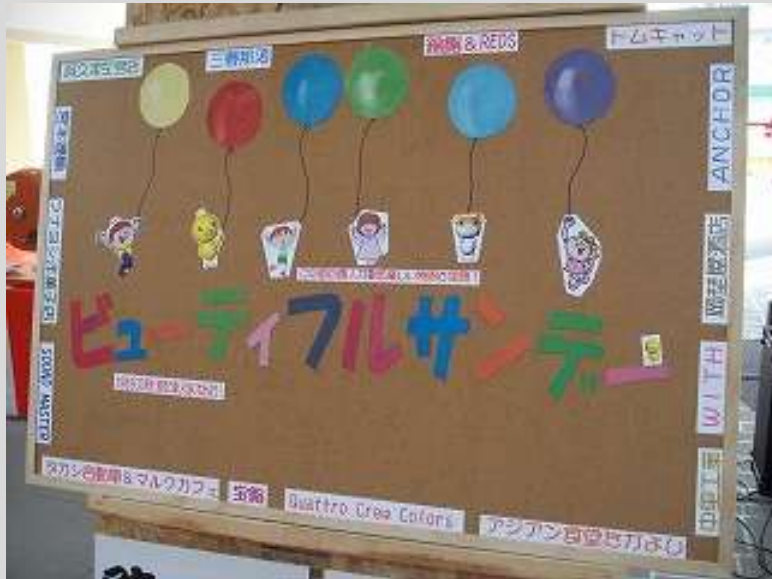
ビューティフルサンデー1周年記念看板作製

桜満開と同時に大雪、今年は寒暖の変化の激しい年ですね。でも、少しずつ暖かくなってきていますね。日本の景気も徐々に良くなってきているのかな？ ゴールデンウィーク 5月2日にそすいスクエア アクアスで珪藻土の壁塗り体験を開催します。それでは今月もありがとう通信を配信します。ご一読ください。