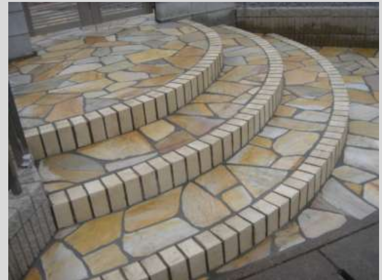
E様邸外構工事 自然石乱貼り

今年の夏は、本当に暑い日が続きましたね。各地で記録を更新したとニュースで報道されていました。当社の職人さんやスタッフも日焼けをして真っ黒です。ここ数日少し涼しくなってきたのでこれからは仕事がしやすいですね。今月も感謝の気持ちを込めてありがとう通信を配信します。ご一読ください。